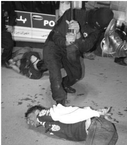
بعمل آورد تا از تصویب این قطعنامه جلوگیری کند، اما شکست خورد.

جمع عمومی سازمان ملل متحد شامگاه پنجشنبه ۲۸ آذر ۱۳۸۷، قطعنامه دیگری در محکومیت نقض وحشیانه حقوق بشر در ایران به تصویب رساند. بدین ترتیب پنجاه و پنجمین قطعنامه محکومیت رژیم سرکوبگر آخوندی به خاطر نقض گسترده حقوق بشر در عالیترین مرجع بین المللی به تصویب رسید.