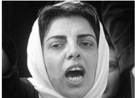
مه‌به‌ستی شیواندنی هێمنایه‌تی وه‌لات رایگه‌یاننده‌وه‌وه‌وه‌ که‌ ئه‌وه‌ حوکمه‌ به‌ پێی ماده‌ی ۶۱۰ یاسای سزادانی ئیسلامی ده‌رکراوه‌.